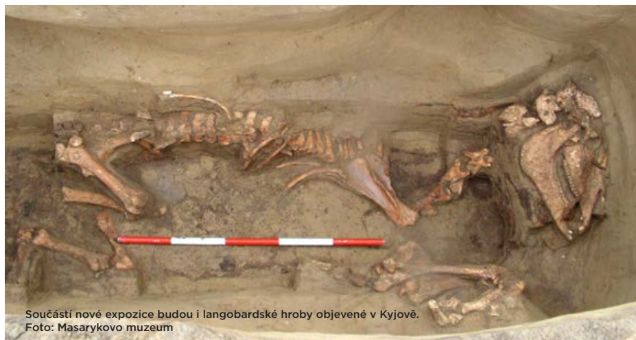
Součástí nové expozice budou i langobardské hroby objevené v Kyjově.

Blanka Pokorná, vedoucí Vlastivědného muzea Kyjov