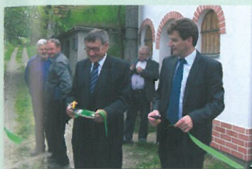
slavnostní otevření naučné stezky

Výbudovanie náučnej stezky bolo prínosom pre obe zúčastnené obce partnerskej spolupráce z dôvodu poskytnutia dôležitých informácií z minulosti a súčasnosti. Obec Breza a obec Moravany zviditeľnili cez projekt svoje charakteristické črty obce, ktoré bolo možné spoznať na informačných paneloch pri otvorení náučnej stezky a tiež konkrétne návštevou obce. Občania Brezy majú možnosť spoznať kultúru Moravan cez fotogalériu na informačnej tabuli obce a tiež na web stránke obce. V rámci projektu sa uskutočnila aj koláčiková slávnosť, kde sa predstavili spevácke súbory oboch partnerských obcí. V budúcnosti obe obce uvítajú ďalšiu spoluprácu v rámci nových projektov.