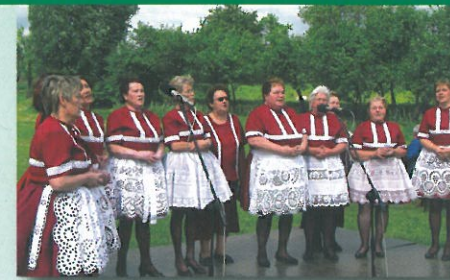
Ženský pěvecký sbor „Moravjanky“ Moravany