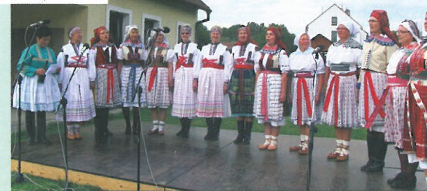
Ženský sbor „Děvčice z Vonice“ ze Zlína

Po takto úspěšném završení celého projektu, na kterém obě partnerské obce spolupracovaly téměř rok, se obě obce rozhodly dále spolupracovat na přípravě dalších společných aktivit. Záměrem do dalších let je především dále posilovat kontakty a přeshraniční vazby vedoucí ke spolupráci obyvatel, místní správy a místních subjektů v oblasti cestovního ruchu, kulturního dění a volnočasových aktivit.