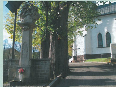
kamenný sloup se souším korunování Panny Marie Nejsvětější Trojici u kostela v Breze

Naučná stezka byla vybudována v rámci Fondu mikroprojektů. Celkové náklady na vybudování naučné stezky činily 8 465,84 Eur, z toho evropský fond přispěl 7 195,84 Eur.