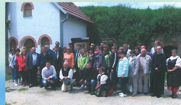
Otvírání naučné stezky v Moravanech - společná fotka hostů z Brezy a občanů Moravan