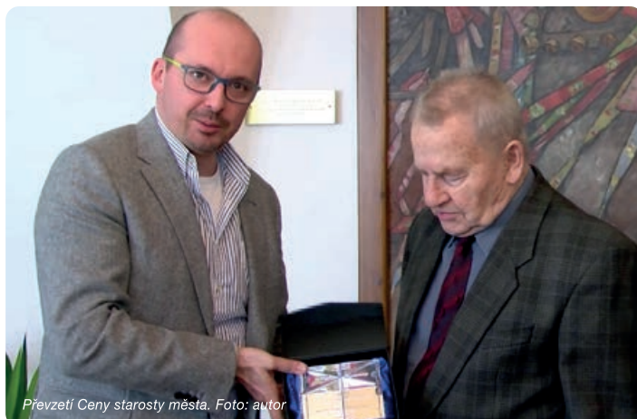
Převzetí Ceny starosty města.