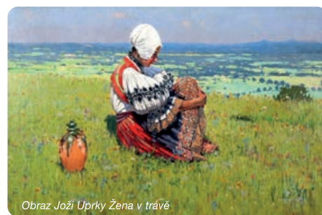
Obraz Joži Uprky Žena v trávě

stroje, který byl delší dobu mimo provoz. V letošním roce je zametací stroj připraven stejně precizně jako v minulosti a ulice města budou technické služby díky tomu opět průběžně zametat, čímž se sníží i množství prachu v ovzduší. Další aktivitou, která už se blíží k realizaci, je vytvoření Uprkovy louky – květnatého prostranství k výročí 80 let od úmrtí světoznámého malíře Joži Uprky, jehož tvorba zachycovala život na Slovácku ve všech jeho nádherných barvách. Výsledkem budou dvě plochy s lučním porostem – jedna v parku u Kaple sv. Josefa a druhá v dolní části ulice J. Uprky. Tyto plochy budou osety speciálně sestavenou směsí bylin tak, aby se na první pohled co nejvíce podobaly barevným loukám na Uprkových obrazech. Pokud se vše podaří, tak občané budou moci od letoška každé léto obdivovat živý luční obraz.