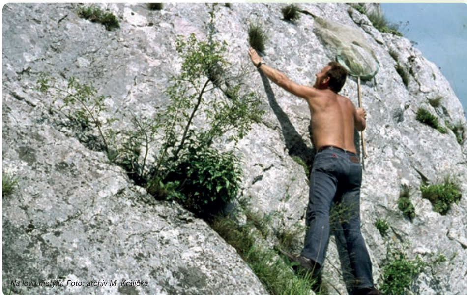
Na lovu motýlů.