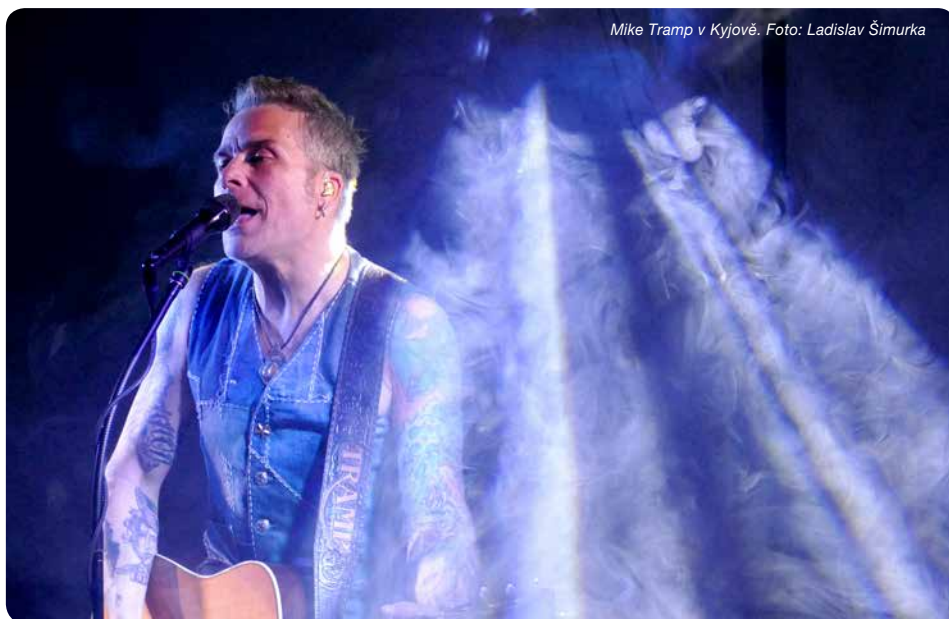
Mike Tramp v Kyjově.