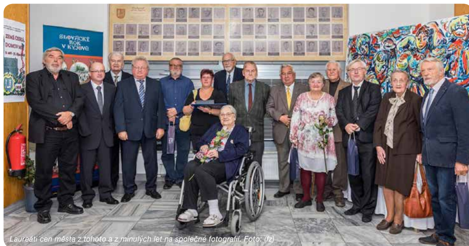
Laureáti cen města z tohoto a z minulých let na společné fotografii.