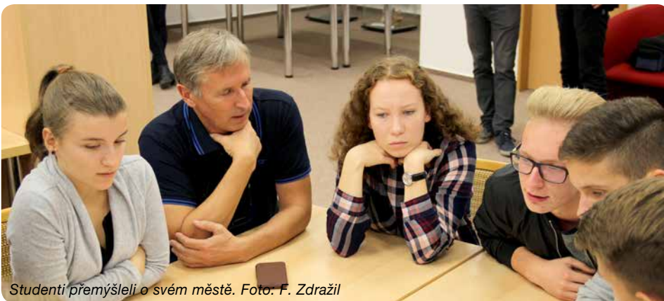
Studenti přemýšleli o svém městě.