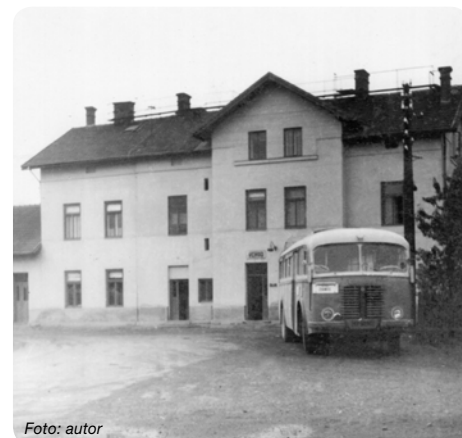
Historická fotografie kyjovského nádraží.