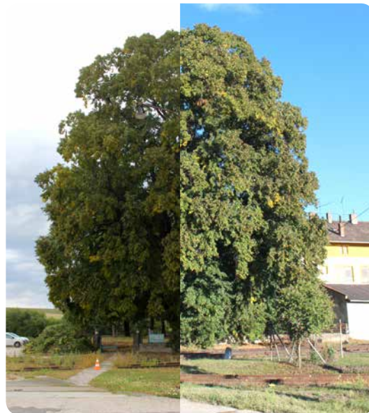
Takto vypadala památná lípa před ošetřením a po něm.