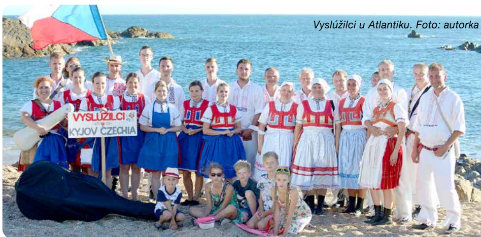
Vyslůžilci u Atlantiku.

Přívál sněhu, ledu a adrenalinu přichází poprvé do Kyjova. Filmový festival SNOW FILM FEST je celovečerní pásmo špičkových filmů o zimních sportech a dobrodružstvích. V programu jsou pečlivě vybrané filmy – finalisté ze zahraničních festivalů a novinky z domácí produkce. Máte se opravdu na co těšit! Prostřednictvím filmového plátna budete bojovat o dosažení vrcholu hory Link Sar, seznámíte se s legendami slovenského skialpinismu, zazávodíte si se psím spřežením, s Honzou Vencou Franckem budete bojovat o vítězství drsného zimního ultramaratonu na Yukonu, vydáte se na expedici do Grónska, budete učit lyžovat děti v Pákistánu a v rytmu hip hopu brázdit prašan v Silvertonu. Přijďte 28. listopadu v 18 hodin do Kina Panorama a nechte se motivovat k zimním výletům, sportovním zážitkům a novým dobrodružstvím. (sf)