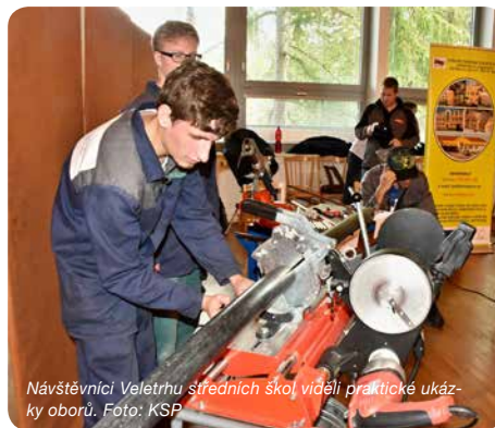
Návštěvníci Veletrhu středních škol viděli praktické ukázky oborů.