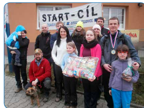
Fotografie nejpočetnější rodiny z březnového putování jarní přírodou Chřiby.