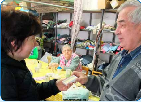
Občanské sdružení Omega Plus z Kyjova objevilo v oděvech odložených k dalšímu využití pro potřebné zlatý řetizek. Prostřednictvím výzvy v Kyjovských novinách se našla jeho majitelka, která si ztracený dárek svého otce přišla vyzvednout.