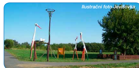
Ilustrační foto Jevišovka