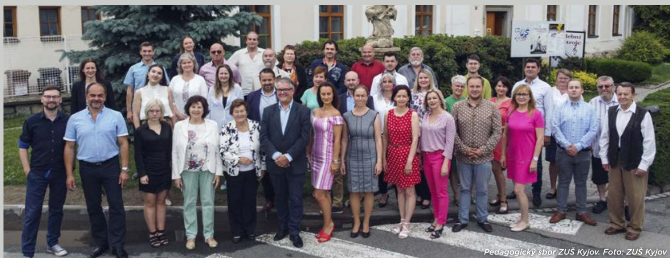
Pedagogický sbor ZUŠ Kyjov.