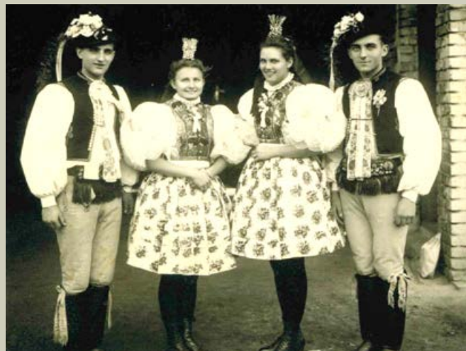
Josef Somr, jak ho publikum nezná. V kroji na fotografii z roku 1951 a na vojně z roku 1959 (uprostřed článku).