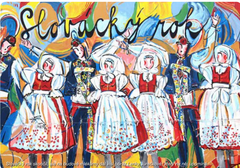
Slovácký rok skončil, ale na budově mlékárny dál visí obraz Lenky Jureckové, který na něj upomíná.