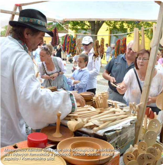
Masarykovo náměstí bylo nejen plné účinkujících a návštěvníků, ale i lidových řemeslníků a prodejců. Několik desítek stánků zaplnilo i Komenského ulici.