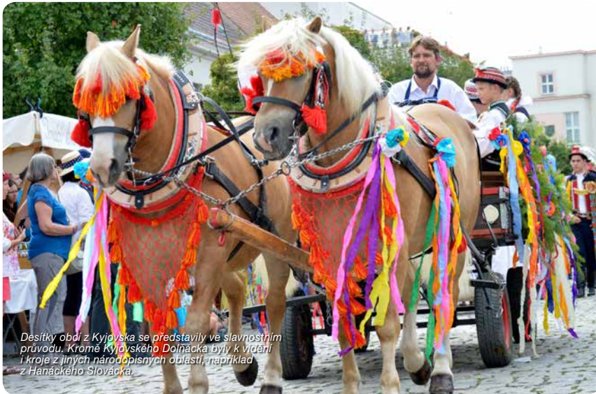
Desítky obcí z Kyjovska se představily ve slavnostním průvodu. Kromě Kyjovského Dolňácka byly k vidění i kroje z jiných národopisných oblastí, například z Hanáckého Slovácka.