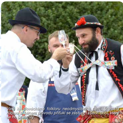
Vino ke slováckému folkloru neodmyslitelně patří. Starosta Kyjova si během průvodu přitůl se zástupci všech obcí, které se ho účastní.