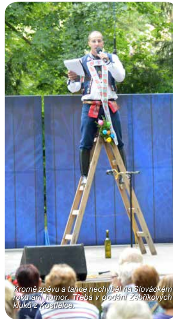
Kromě zpěvu a tance nechyběl na Slováckém roku ani humor. Treba v podání Zebříkových Kluků z Kostelce.