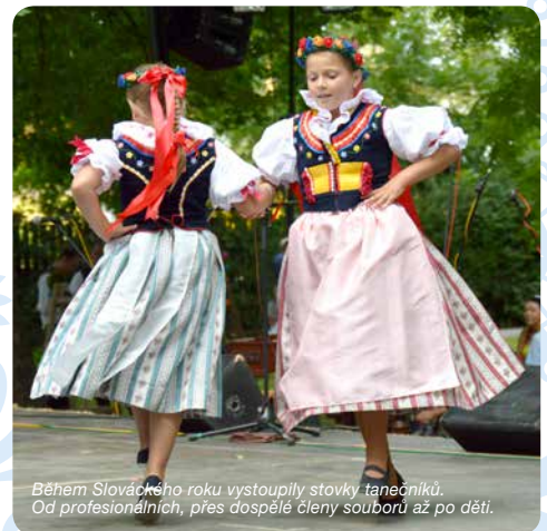
Během Slováckého roku vystoupily stovky tanečnicků. Od profesionálních, přes dospělé členy souborů až po děti.