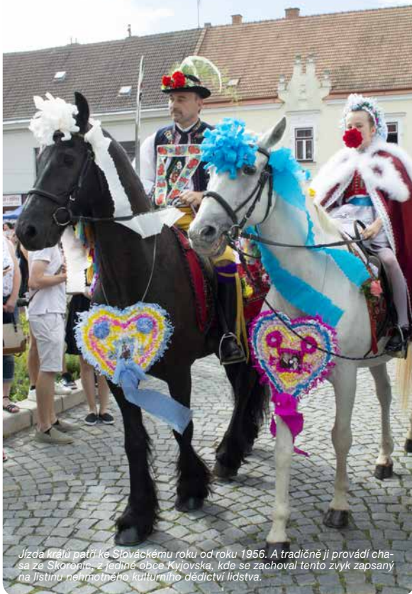
Jízda králů patří ke Slováckému roku od roku 1956. A tradičně ji provází chasa ze Skoronice, z jediné obce Kyjovska, kde se zachoval tento zvyk zapsaný na listinu nemotného kulturního dědictví lidstva.