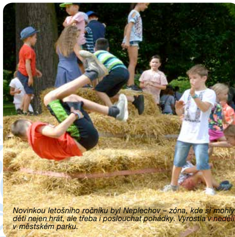
Novinkou letošního ročníku byl Nephochov – zóna, kde si mohly děti nejen hrát, ale třeba i poslouchat pohádky. Vyrosla v neděli v městském parku.