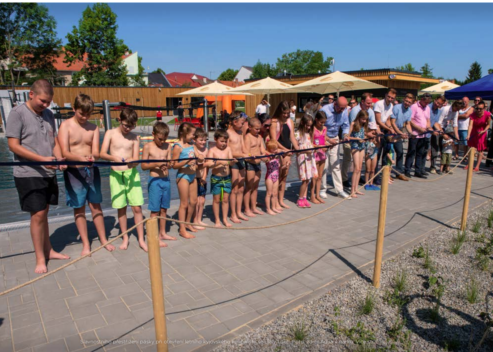
Slavnostního přestřižení pásky při otevření letního kyjovského koupaliště se ujaly i děti. Více str.

TAK TLUČE SRDCE NAŠEHO MĚSTA / VYDÁVÁ MĚSTO KYJOV / ZDARMA