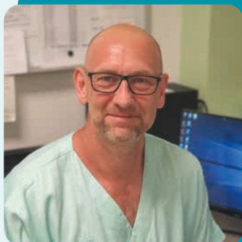
Vážený přítel Nemocnice Kyjov,

s novým rokem přichází nové výzvy a plány a rád bych Vás seznámil s tím, co nás čeká v naší nemocnici v průběhu následujících měsíců.