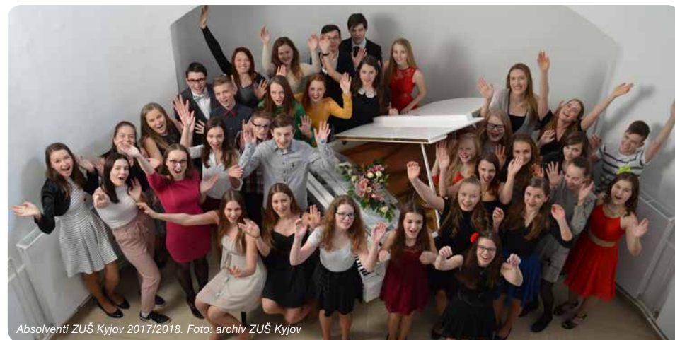
Absolventi ZUŠ Kyjov 2017/2018.