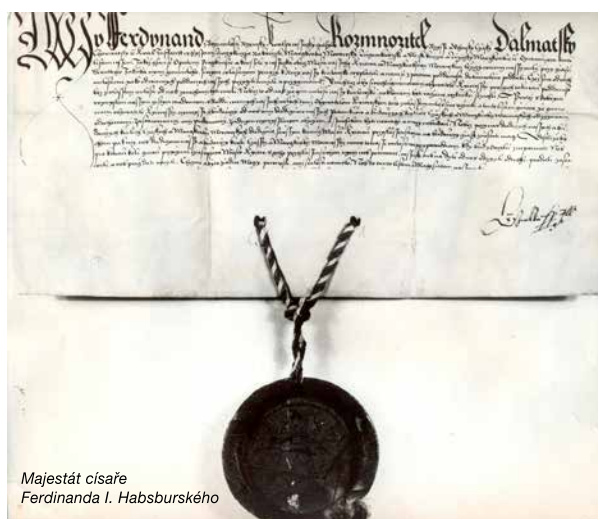
Majestát císaře Ferdinanda I. Habsburského