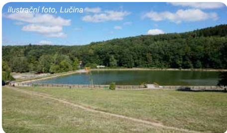
ilustrační foto, Lučina