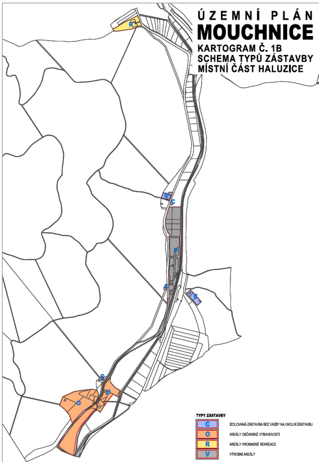
Kartogram 1B: Schéma typů zástavby – místní část Haluzice