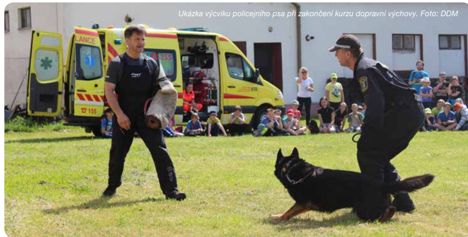
Ukázka výcviku policejního psa při zakončení kurzu dopravní výchovy.