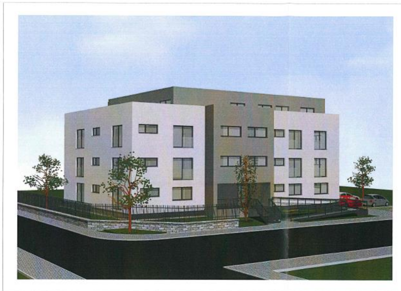
Návrh barevného řešení Baumit Life