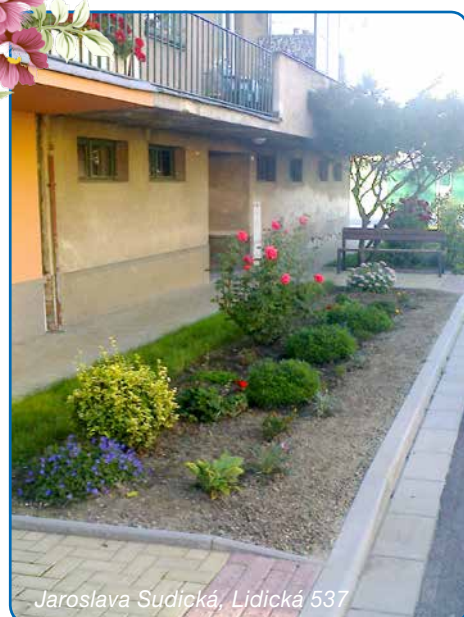
Jaroslava Sudická, Lidická 537