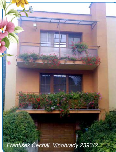
František Čechál, Vinohrady 2393/2