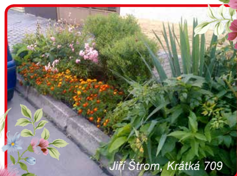
Jiří Štorm, Krátká 709