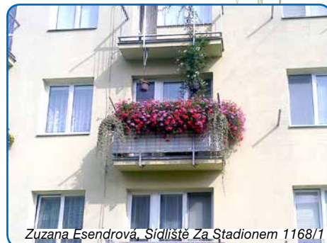
Zuzana Esendrová, Sídliště Za Stadionem 1168/1