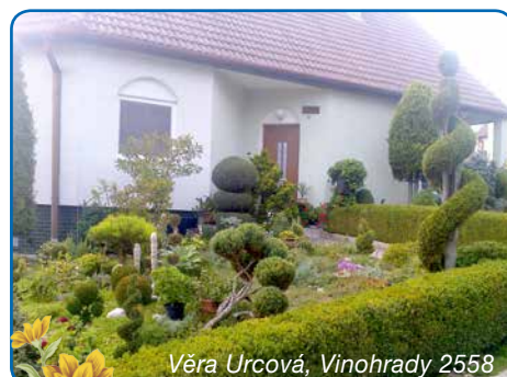
Věra Urcová, Vinohrady 2558