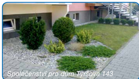
Společenství pro dům Tyršova 143