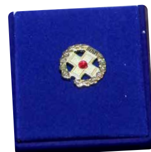
Zlatý kříž prof. Janského