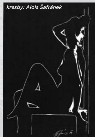
kresby: Alois Šafránek